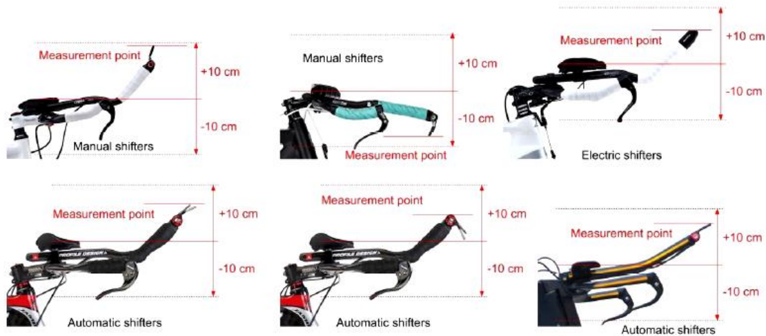
Figure 41: Points of measurement for the vertical limits of the handlebars extensions and any accessories

Morfologiset syyt: riittää kun kilpailija on itse mukana pyörän tarkastuksessa. Ajoasennon täytyy olla sääntöjen mukainen ja myös turvallinen.